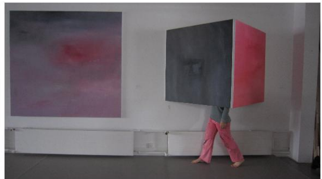
Cathy Josefowitz, Autoportrait / Maison, 2013, Huile sur toile

Moving Walls illustre l'interaction entre architecture et expérience spatiale, entre théâtre et danse. En collaboration avec l'architecte Lorenzo Piqueras, un accrochage a été conçu spécialement pour la halle d'exposition de FABRIKculture : des œuvres jaillissent dans l'espace, nouent des relations réciproques et décalent ainsi les ordres architectoniques. Les œuvres jouent avec le sol, la hauteur des murs et du plafond. Disposées de manière convexe ou concave et de tailles diverses. Elles font naître des angles décisifs, parfois refuges, parfois appuis, mais décidément centraux dans l'accrochage. Cette installation interpelle ainsi le public par cette nouvelle appréhension de l'espace. Dans sa démarche, Cathy Josefowitz tente de mouvoir et émouvoir le spectateur, spatialement et affectivement.