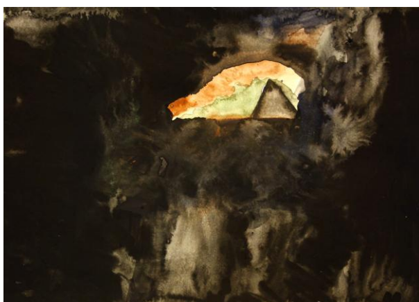
Camuse, 2012 (Höhle) / 2012 / Aquarelle / 21 × 29,7 cm