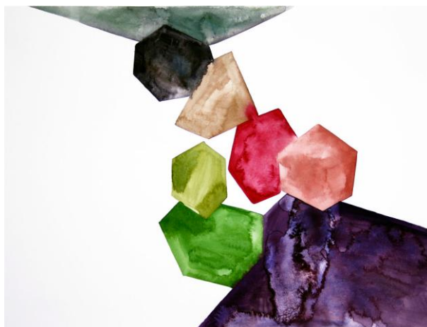
Anstösser / 2012 / Aquarelle / 40 x 30 cm