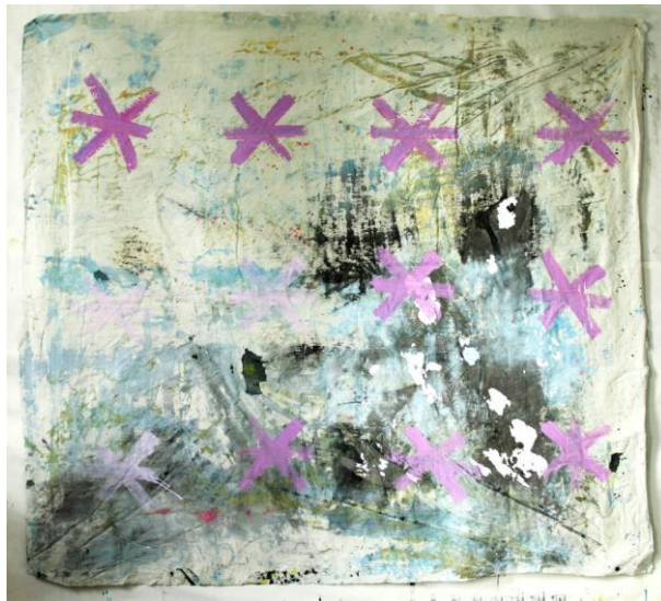
Série 14, Sans titre / 2012 / Gouache, acrylique et encre sur toile / 157 x 170 cm

Karin Aeschlimann présente des peintures en grand format, toiles sans cadre, accrochées à même le mur et une dizaine de petites aquarelles sur papier. Son travail est un jeu subtil entre construction et dissolution. Des traces de couleur qui sans arrêt échappent à la gravité. Les couches de peinture, se superposent, se mélangent, se coulent sur la toile et pénètrent dans le support. L'œil cherche en vain le centre de la composition. L'artiste contrôle le flux de ces empreintes sur la surface et nous entraîne dans un paradoxe où profondeur et mise à plat cohabitent.