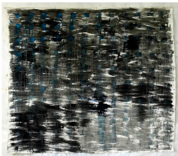
Série 15, Sans titre / 2012 / Gouache et acrylique sur toile / 143 x 163 cm