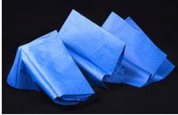
Tissue I / 2012 / Photographie couleur sur dibond / 120cm x 160cm