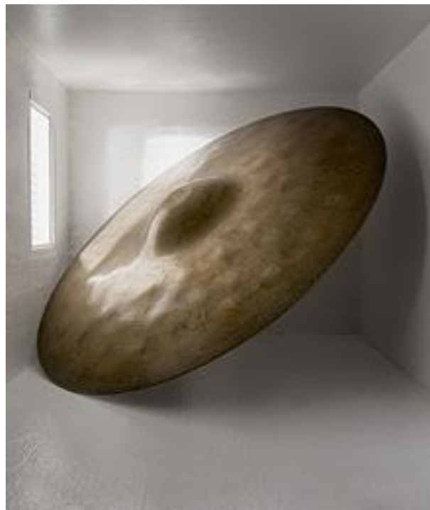
Chameleon III / 2011 / Photographie couleur sur dibond / 70cm x 100cm