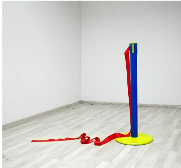
Lido / 2013

Tashi Brauen est un illusionniste. Il met en scène des objets dans un espace réel ou bien dans des petites maquettes construites par lui-même. Les objets sont surdimensionnés, les couleurs saturées, les contrastes de lumière exacerbés. L'artiste manipule notre perception du réel et explore les relations entre les objets et l'espace qu'ils occupent. En utilisant des sources de lumière colorées, il construit des images surréelles et défie ainsi le medium de la photographie comme simple outil de représentation de la réalité.